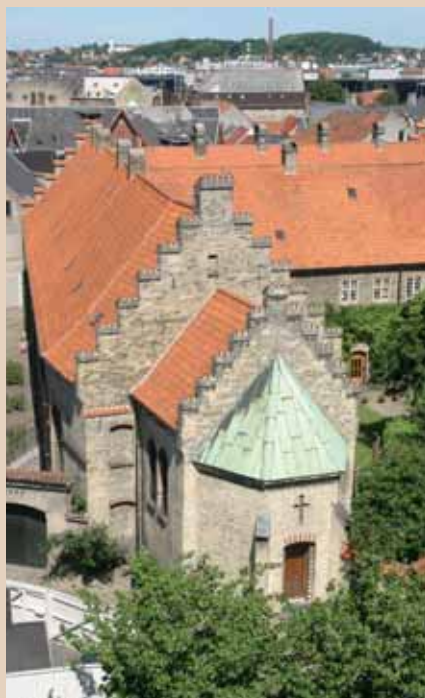
Klosterkirken, set fra syd. Skibets knæk mod øst ses tydeligt.

Af den nuværende Klosterkirke er hoveddelen, svarende til kirkeskibet, indrettet i en af det middelalderlige Helligåndsklosters fløje, mens de øvrige bygningsafsnit, kor og apsis er yngre tilføjelser. Kirken er således et sjældent eksempel på en kirke, der for størstepartens vedkommende ikke er opført til formålet. Genanvendelsen af en tidligere klosterfløj har resulteret i en kirke, der, anderledes end det