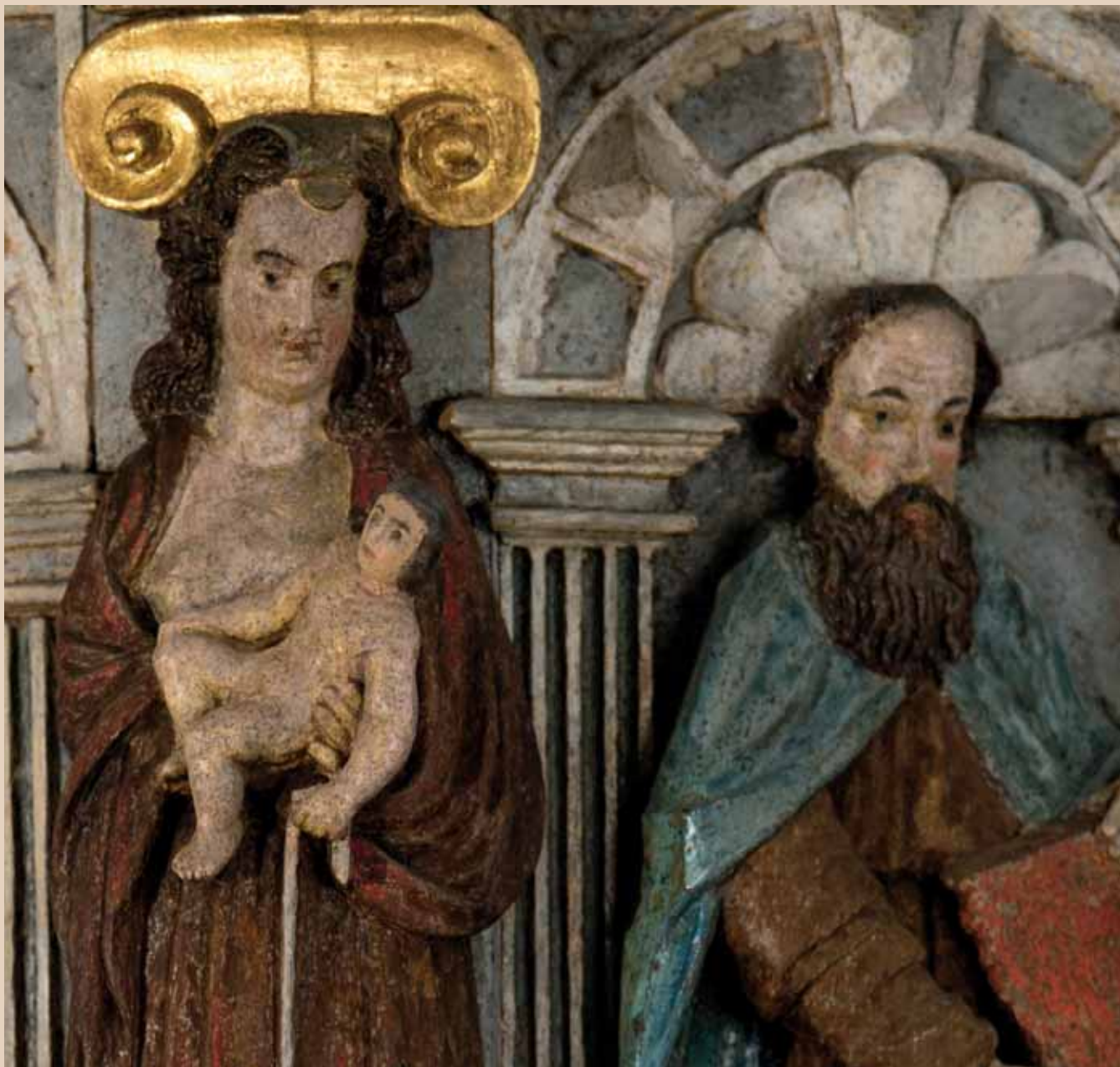
Ved renoveringen 2010 fik Jesusbarnet nyt hoved. Detalje fra prædikestol.