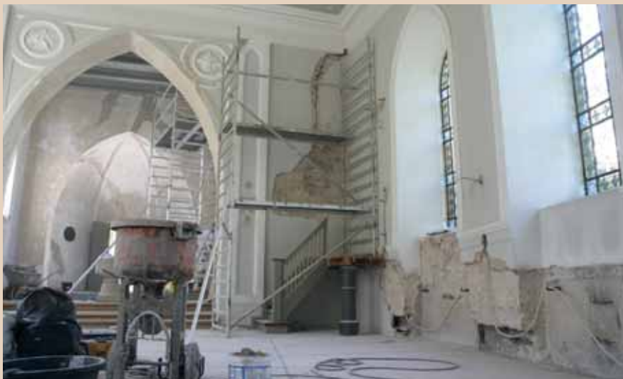
Ved renoveringen i 2010, blev partier af det oprindelige murværk fra det middelalderlige kloster blottet, hvorved tilmurede åbninger blev synlige i skibets sydlige og østlige mure.

Et ejendommeligt træk ved kirkeskibet er, at den sydligste del slår et tydeligt knæk mod øst. Flere tvivlsomme forklaringer er givet på dette knæk. Der synes dog at være tale om et oprindeligt træk ved bygningen og altså ikke et resultat af en ombygning. Dette ses bl.a. ved at den skævhed, der findes i knækkets kælderhvelvinger, så at sige forplanter sig gennem kælderenes øvrige hvelvinger. Et resultat af knækket er desuden, at sydgavlen i Klosterets vestfløj kommer til at ligge parallelt med sydgavlen af den sydlige østfløj, den såkaldte skolefløj, der husede Latinskolen. Skolefløjens sydgavl indeholder stadig rester af Klosterets forsvundne kirke, der lukkede den sydlige gård mod syd. Denne gavlvise viser dermed, hvorledes kirken har været orienteret. Det må ligeledes være kirkens orientering, der har dikteret orienteringen af vestfløjens sydgavl og dermed knækket