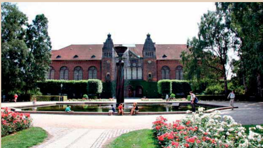
Vandkunsten til Johannes Wiedewelt, placeret i Det Kgl. Biblioteks have (1999).